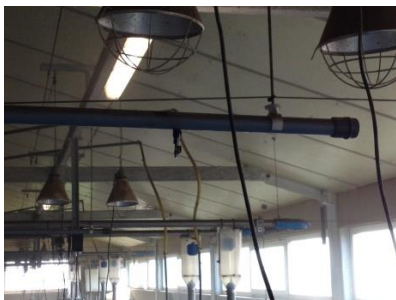
PVC-buizen van 32 mm