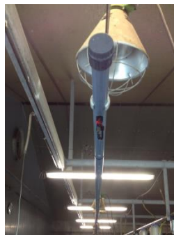
uiteinde van PVC-leiding