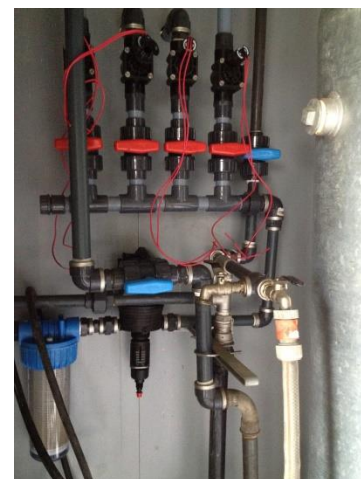
kogel- en/of elektrische kranen en watergedreven proportionele doseerpomp