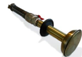
A32+GEKA с A751

Наличие знака ' + ' в коде артикула, указывает на наличие сферического клапана на поливной стойке.