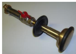
B22+GEKA с B401