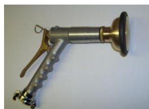
B22+GEKA с B401