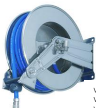
VH464194 VH464170 VH464172 VH464124