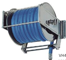
VH464152 VH464158 VH464124